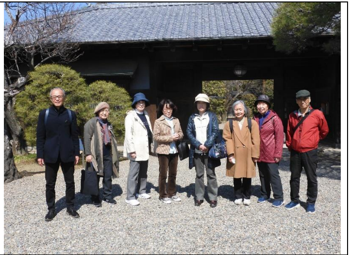
遠山記念館の門の外で