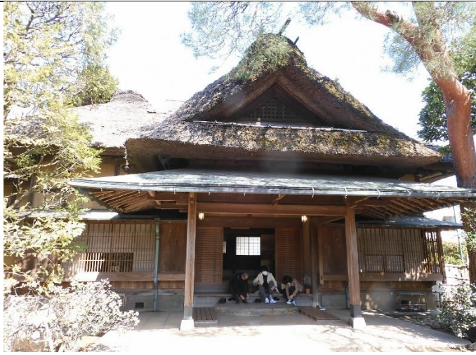
遠山記念館 表玄関