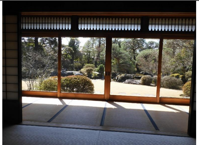
遠山記念館 部屋から庭を