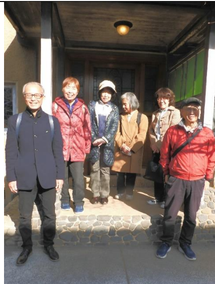
旧山崎家別邸 玄関前で