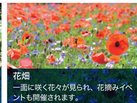
花畑 一面に咲く花々が見られ、花摘みイベントも開催されます。