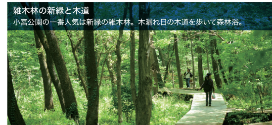
雑木林の新緑と木道 小宮公園の一番人気は新緑の雑木林。木漏れ日の木道を歩いて森林浴。