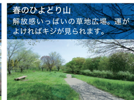
春のひよどり山 解放感いっぱい草地広場。運がよければキジが見られます。