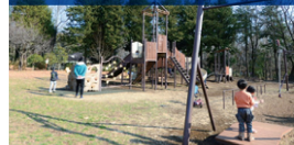
遊具広場 複合遊具やターザンロープなどの遊具で遊べます。