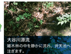
大谷川源流 雑木林の中を静かに流れ、弁天池へ注ぎます。