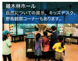
雑木林ホール 自然についての展示、キッズデスク、野鳥観察コーナーもあります。