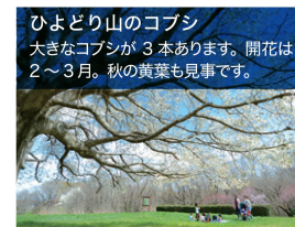
ひよどり山のコブシ 大きなコブシが3本あります。開花は2〜3月。秋の黄葉も見事です。