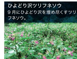
ひよどり沢ツリフネソウ 9月にひよどり沢を埋め尽くすツリフネソウ。