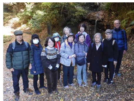
三郎の滝の前-切通入口