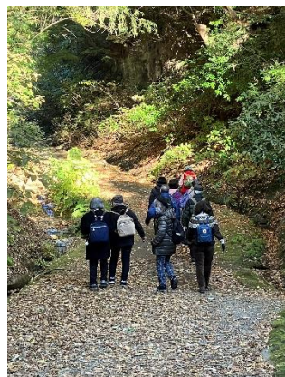
朝夷奈切通し出発