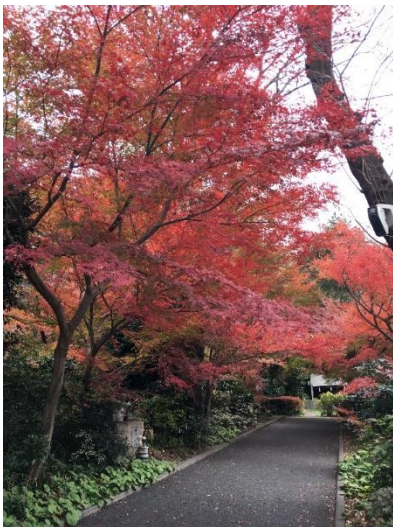
2021年12月7日の徳善寺の紅葉