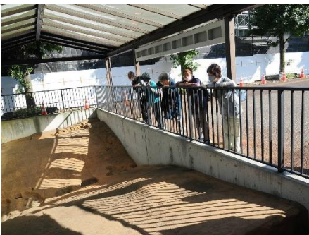
東山道武蔵路遺跡を見る