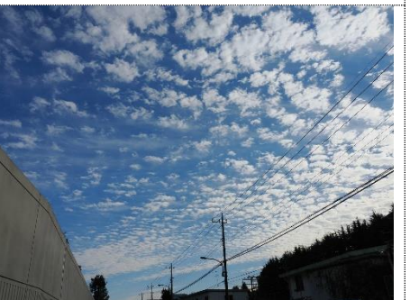
刑務所塀と秋の空（うろこ雲）