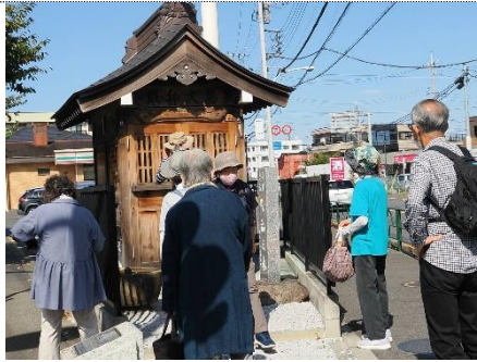
東恋ヶ窪 島大弁財天