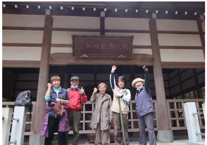
秩父御嶽神社前で