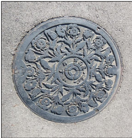
吹上駅前 町の花コスモス