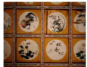
格天井花鳥画、本堂前に写真がある

一般に百花百鳥といわれていますが、牡丹等の植物が 100 枚のほか、鳥類が 64 枚、色彩や構図を変えた鳳凰が 35 枚、そして中央部分に龍の絵が 1 枚配置され、合計で 200 枚描かれています。