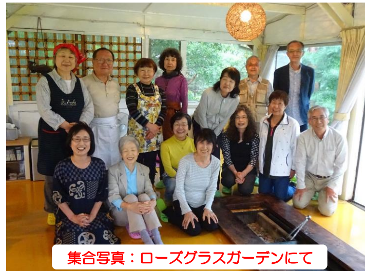
集合写真：ローズグラスガーデンにて