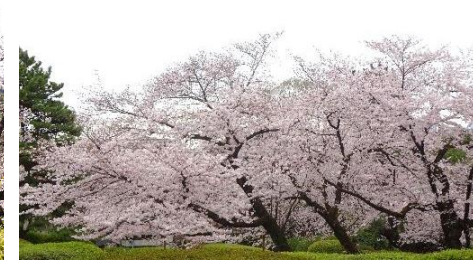
哲学堂公園の 3 月 30 日、4 月 3・7 日の桜