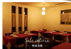
Sala Intima 特別空間