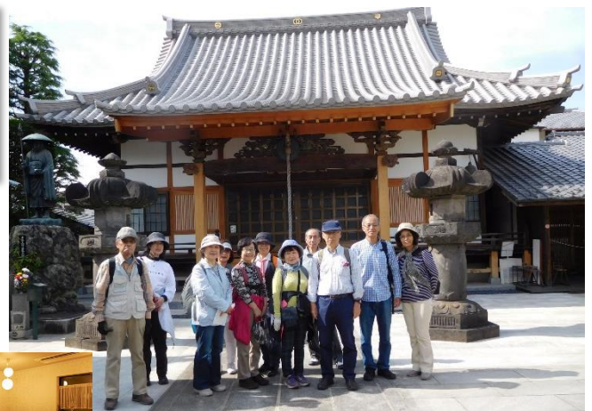
ウォーキングスタイルで食事をしたレストランの特別空間