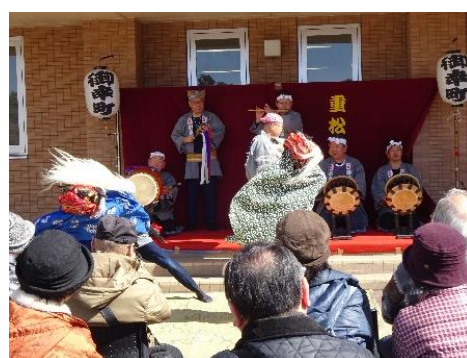
重松流祭ばやし特別演奏会のスナップ