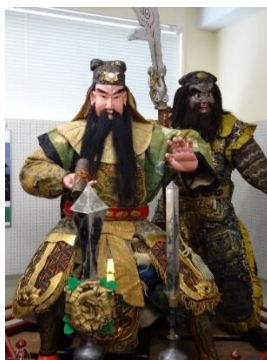
二代原舟月作 御幸町山車人形「関羽・周倉」