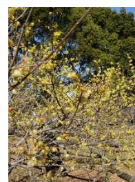
蠟梅 (未だ咲いて いました)

2月のオフション行事に予想したよりは参加者が多く、所沢の文化財を数多く間近に鑑賞でき、又食事も楽しんだ会になりました。次回の博物館めぐりは神奈川県立歴史博物館と中華街で昼食の会を計画しています。詳細が決まり次第連絡いたします。