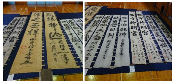
幟(左写真：勝海舟) 発揚神徳・降之百祥