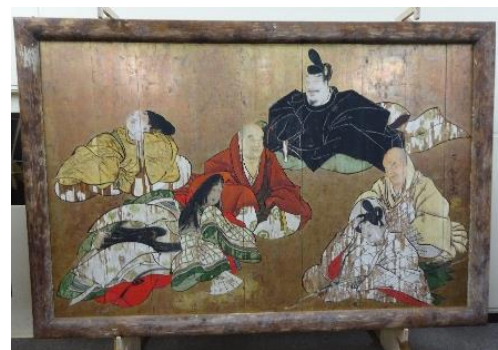
石川文松筆 六歌仙大絵馬