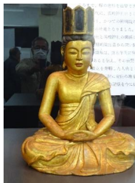
木造大日如来坐像