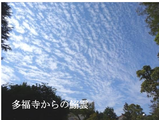
多福寺からの翳雲

今回の 10 月行事は 9 月行事が雨天で中止のために 2 カ月振りの実施となり絶好の天気恵まれ、楽しく一日を歩きました。気候はもう秋で多聞院では柿が、多福寺では秋の雲の翳雲、三富の芋街道ではさつまいも販売が実施されているのを横目に見ながら三富地区の散策を楽しみ、南永井の八幡神社を經由してエスティシティから航空公園駅に出て解散、無事に今回も終了しました。