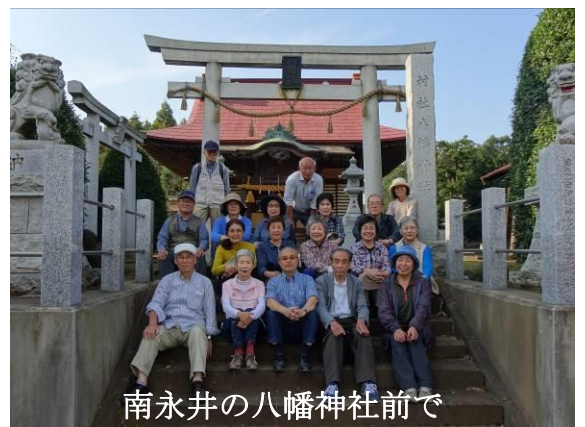
南永井の八幡神社前で