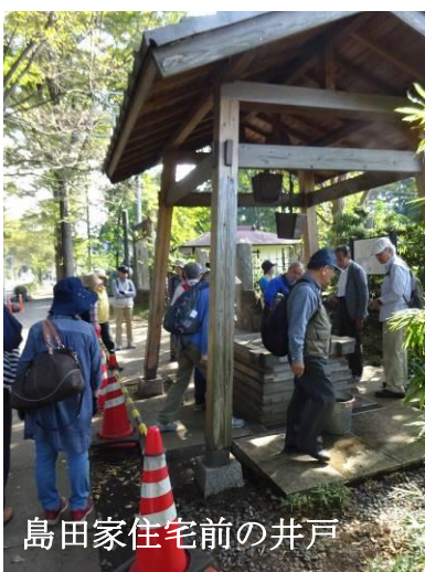
島田家住宅前の井戸