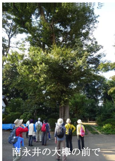
南永井の大櫨の前で