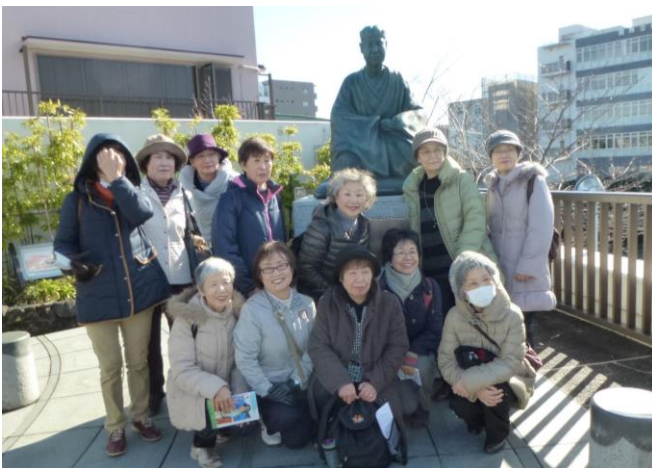
芭蕉像の前でところ会の美女軍団