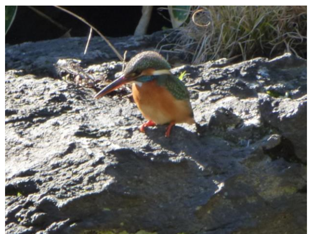
清澄庭園で出会ったカワセミ

清澄公園でカワセミに出会い、近寄っても逃げずじっと小魚を狙っていたのが印象的でした。