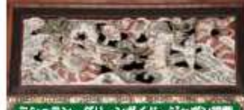
法善寺のもう一つの見所は本堂の欄間です。江戸中期の彫刻師、後藤正綱による作で、中央に龍、両脇には獅子と虎の彫刻が施されています。

宿根草で境内には、青紫・白の可憐な花が咲き誇ります。山上憶良が詠んだ「あさがおの花」が結核を指しているといわれています。 野上駅下車徒歩10分 9月上旬～10月下旬 0494-66-0235