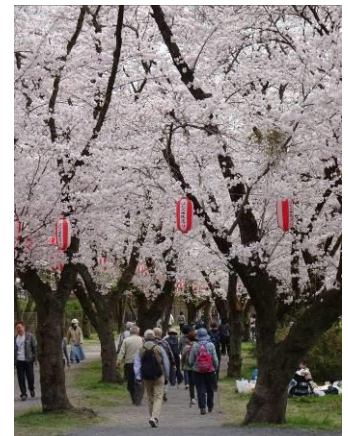
桜 3 題(左から、多摩川の土手の桜/赤門と桜/羽村の桜祭りと桜)