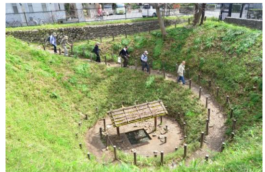
まいまいず井戸を下る会員と井戸の全景

時期がよく、満開の桜と途中の根がらみ前水田のチューリップも一部咲きはじめ桜とチューリップを鑑賞し、4月の行事をおおいに楽しみました。