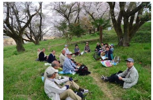
多摩川の河原での昼食時のスナップ写真