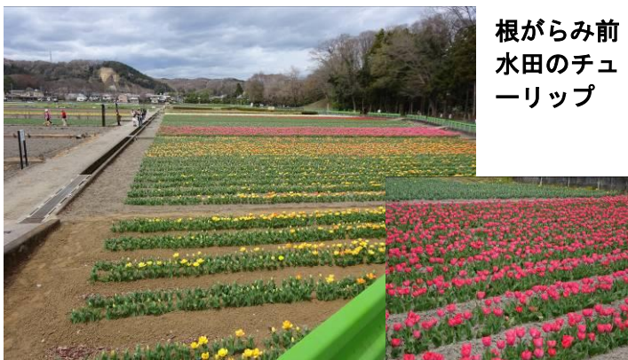
根がらみ前 水田のチュ ーリップ