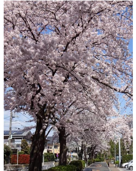
所沢の桜 (航空公園駅の新所沢駅寄り踏切前)