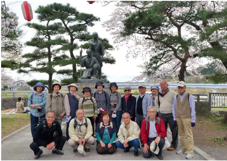
玉川兄弟の像の前で参加者全員の撮影