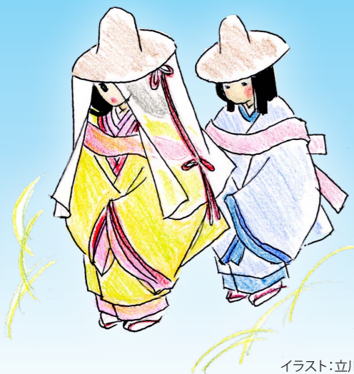
イラスト:立川 明子